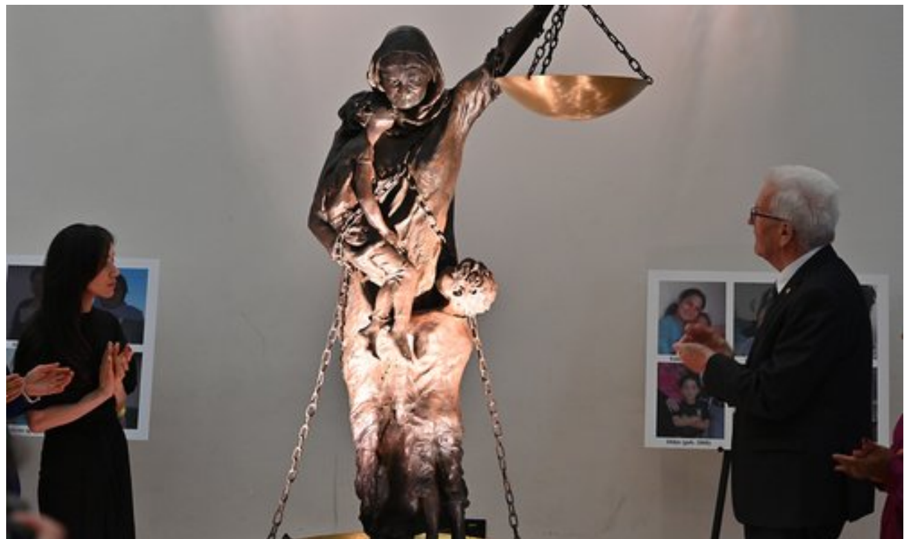
دایک و دادپهروهی – لە سەرەتای ئەم مانگەدا پەردە لەسەر مۆنۆمێنتێکی گەڕۆک لە شاری شتوتگارتی ویلا یەتیی بادن-فورتیمبیرگ لە ئەلمانیا لادا. وێنەکە لە ماڵپەری دەستپێشخەری نادیا وەرگراوه.