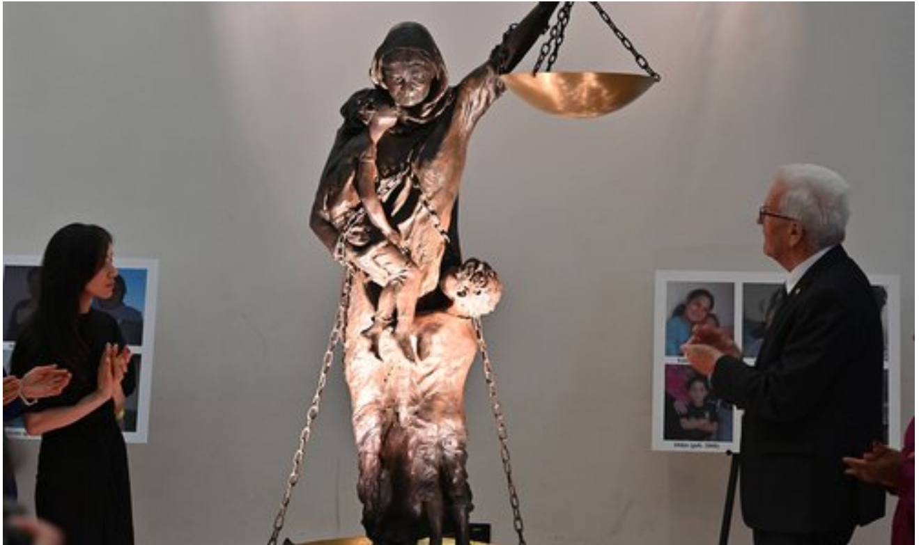
الأم والعدالة – تم ازاحة الستار عن نصب تذكاري متنقل في شتوتغارت، بادن فورتمبيرغ، ألمانيا في وقت سابق من هذا الشهر.

• تم اصدار حلقتين جديدتين من سلسلة البودكاست/الحلقات الاذاعية الخاصة بتحالف التعويضات العادلة التي بعنوان " اكثر من حبر على ورق: تنفيذ قانون الناجيات الأيزيديات". الحلقة