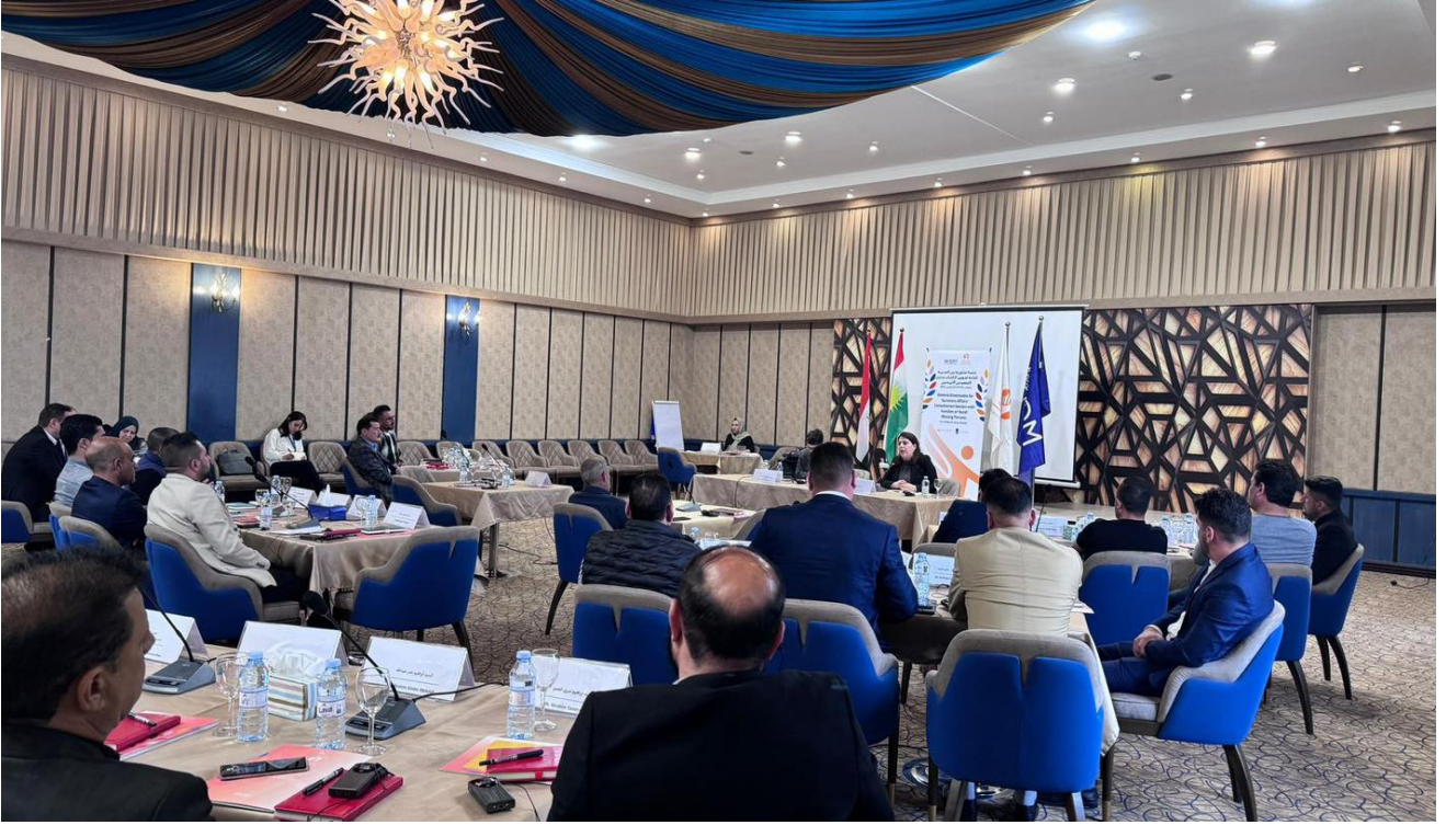
استضافت المديرية العامة لشؤون الناجيات والمنظمة الدولية للهجرة جلسة تشاورية مع ذوي الضحايا والمفقودين لمعالجة مختلف القضايا.