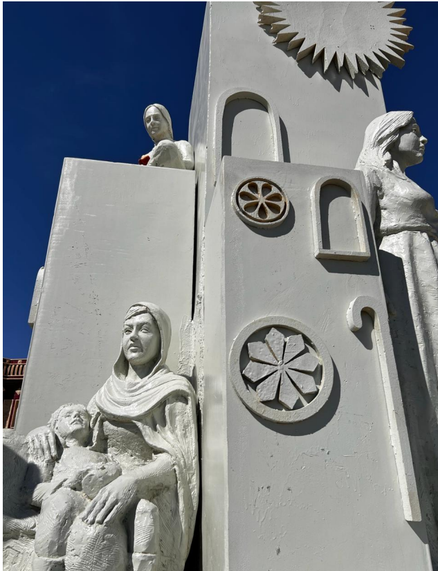
الإجراء التعويضي الجماعي المؤقت الذي اتخذته صندوق الناجيات العالمي في صنعاء، هو بمثابة نصب تذكاري لجميع النساء اللاتي عانين من أسر داعش.